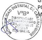
MATRIZ DE IDENTIFICACIÓN DE IMPACTOS AMBIENTALES

EN LO QUE CONCIERNE A EMPLEO DE EQUIPOS, ESTOS SI BIEN ES CIERTO EN RUIDOS, SERÁN EMPLEADOS PUNTUALMENTE Y POR CORTOS PERIODOS DE TIEMPO, EN CUANTO A LA CONTAMINACIÓN DEBERÁN PREVIAMENTE RECIBIR MANTENIMIENTO DE TAL MANERA QUE SE MINIMICE EL DESPIDO DE GASES CONTAMINANTES. LUEGO EL ANÁLISIS DE IMPACTO A LOS MEDIOS FÍSICOS, BIOLÓGICOS Y SOCIOECONÓMICOS COMO RESULTADO DE LA EJECUCIÓN Y PUESTA DE SERVICIO DEL PROYECTO EN SU CONJUNTO, POR LAS CARACTERÍSTICAS PARTICULARES DE LA OBRA Y LA PEQUEÑA ENVERGADURA FÍSICA DE LA INFRAESTRUCTURA, GENERA EFECTOS NEGATIVOS SIGNIFICATIVOS. SIN EMBARGO, SE HAN IDENTIFICADO LOS IMPACTOS QUE PODRÍAN PRESENTARSE EN LA ETAPA DE CONSTRUCCIÓN PRINCIPALMENTE, ASÍ COMO SE HA PLANTEADO LAS MEDIDAS DE MITIGACIONES DICHOS IMPACTOS.