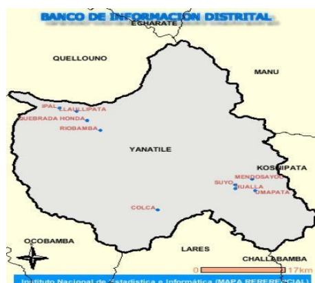
Figura 2: Mapa de ubicación del distrito