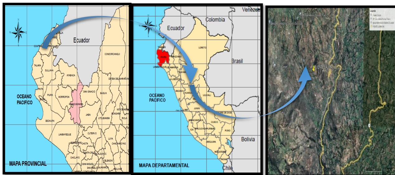
Figura N°01. Ubicación del proyecto a nivel departamental, provincial y Local