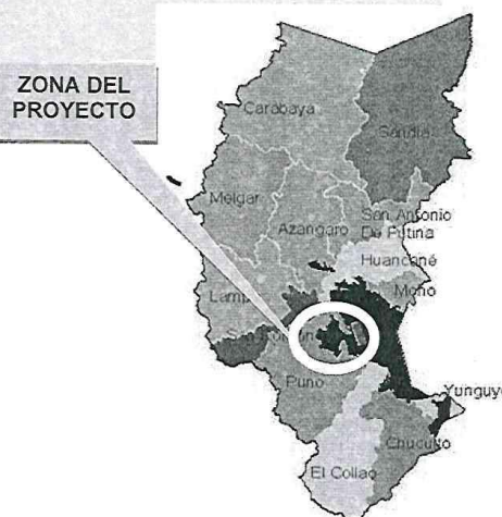
Mapa Distrito de Puno en el departamento de Puno