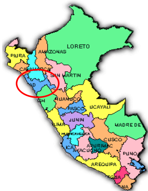
Figura N° 01. Ubicación del Departamento de La Libertad en el Perú