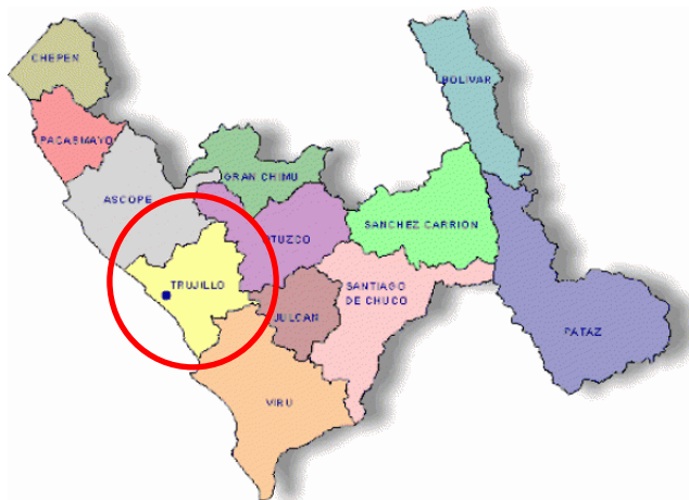
Figura N° 02. Ubicación de la Provincia de Trujillo en el Departamento de La Libertad