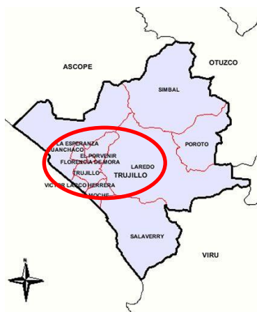
Figura N° 03. Ubicación del Distrito de Florencia de Mora en la Provincia de Trujillo