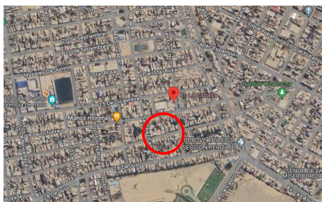
Figura N° 05. Ubicación de la Zona de Intervención en el Centro Poblado de Florencia de Mora