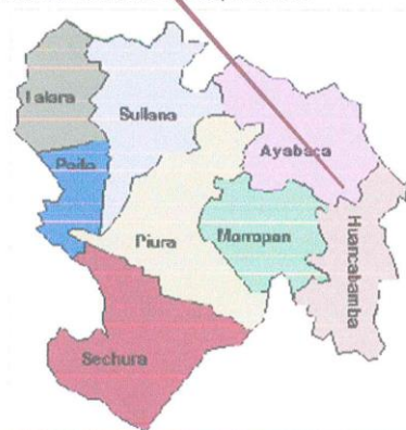
TÉRMINO DE REFERENCIA