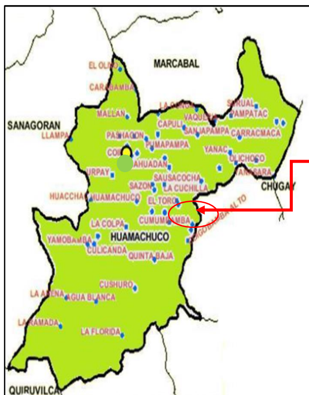
Imagen N° 04: Ubicación del Caserío El Toro en el Distrito de Huamachuco