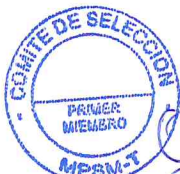
SALOMON GUERRA GUERRA Primer Miembro