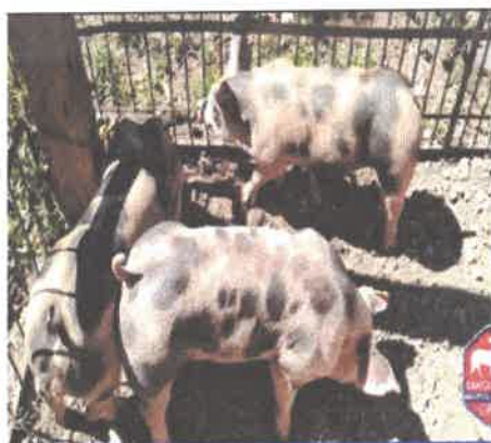
CERDOS PIETRAIN X DUROC