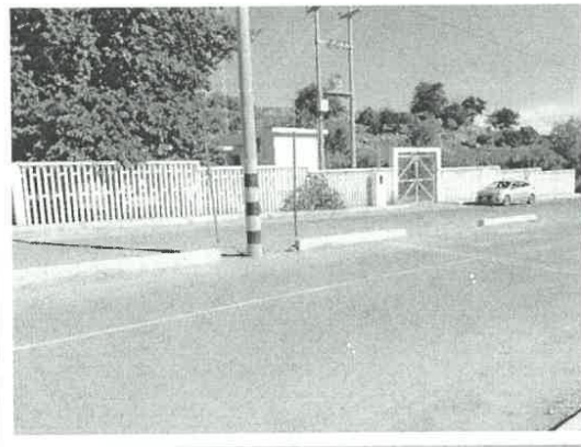
Estación de Bombeo El Totoral

Se está proyectando una Cisterna Enterrada de V=320.00\text{m}^3 la misma que regulará y abastecerá toda el área de influencia, esta se encuentra ubicada dentro de la Estación de Bombeo El Totoral, terreno perteneciente a la EPS Moquegua S.A.