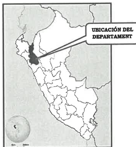
Gráfico N°02: Ubicación de la Provincia San Ignacio