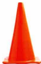
CONO DE SEGURIDAD