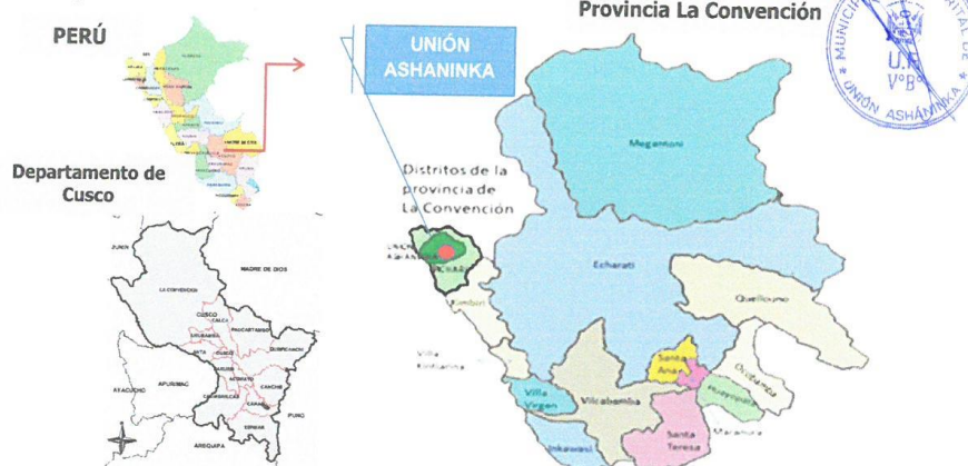
Mapa 1. Macro localización

Los mapas siguientes detallan la macro y micro localización donde se ubicará el proyecto.