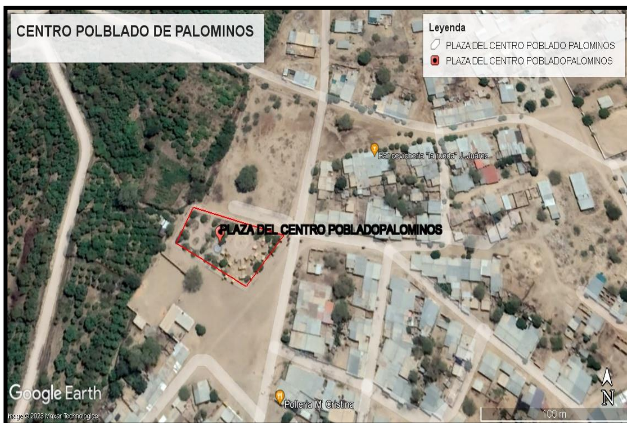
IMAGEN 01: LOCALIZACION DE LA PLAZA DEL CENTRO POBLADO DE PALOMINOS EN EL DISTRITO DE TAMBOGRANDE - PROVINCIA DE PIURA - DEPARTAMENTO DE PIURA".