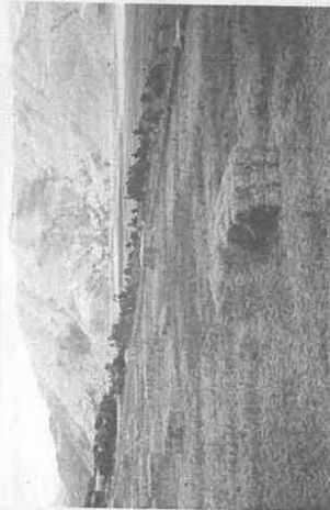
Producción de forraje verde de la avena INIA 903 - Tayko Andenes para su conservación en heno

* Semanas transcurridas desde la iniciación de la floración.