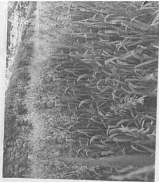
Núcleo de multiplicación de semilla genética de INIA 903-Avena