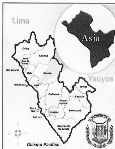
MAPA DISTRITO DE ASIA