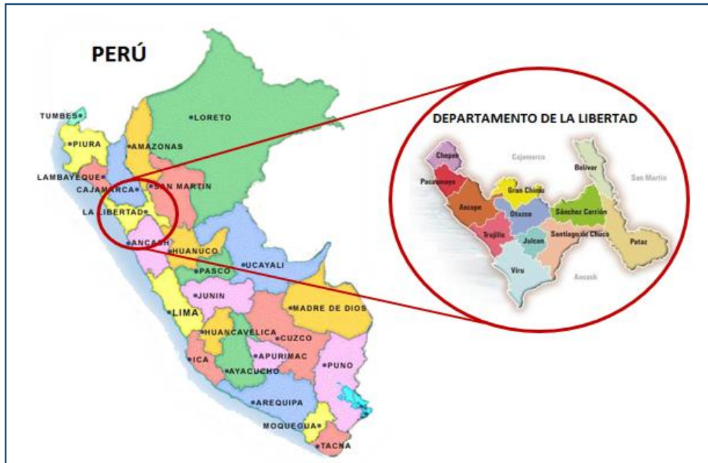
FIGURA 01: Ubicación Geográfica de la Región La Libertad