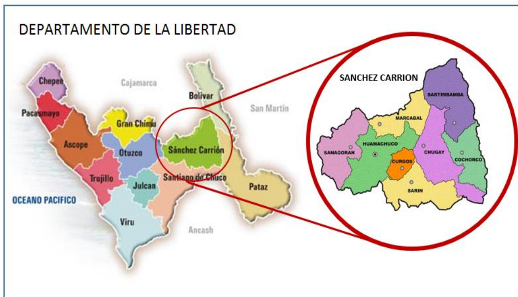
FIGURA 02: Ubicación y Localización de Huamachuco