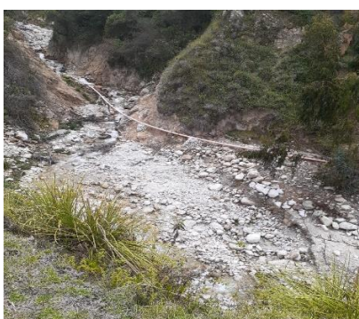
Canal de Tierra