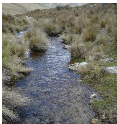
Canal de Tierra

Línea de Conducción: Es un canal principal con tubería de 160mm clase 10 de manera artesanal, esta construcción fue realizada con participación de la población de los Caseríos de Quisuar, Anchin, Cashairca, Marca y Niñahuain, esta línea de conducción tiene una longitud de 8km.