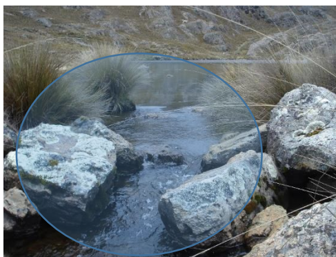
Captación en laguna, hecho de piedra

Línea de Conducción: Es un canal principal con tubería de 160mm clase 10 de manera artesanal, esta construcción fue realizada con participación de la población de los Caseríos de Quisuar, Anchin, Cashairca, Marca y Niñahuain, esta línea de conducción tiene una longitud de 8km.