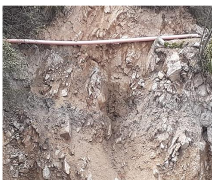
Tubería Expuesta a derrumbes

Como se puede visualizar en las imágenes es un canal en partes con tubería lo que el aprovechamiento del recurso hídrico es de un 50% añadiendo a ello se encuentra expuesta a la intemperie y pequeños derrumbes lo cual provoca la pérdida de recurso hídrico.