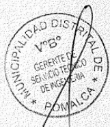
Anexo N° 1 "Documentación para la presentación de la valorización"