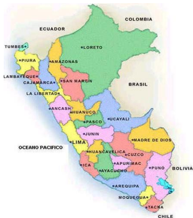
Figura N° 01: Ubicación del departamento La Libertad dentro del mapa del Perú.