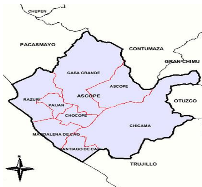
Figura N° 04: Ubicación donde se ejecutará la construcción del almacén.