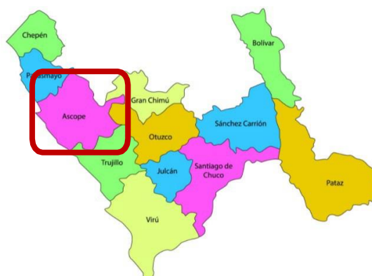
Figura N° 02: Ubicación de la Provincia de Ascope.