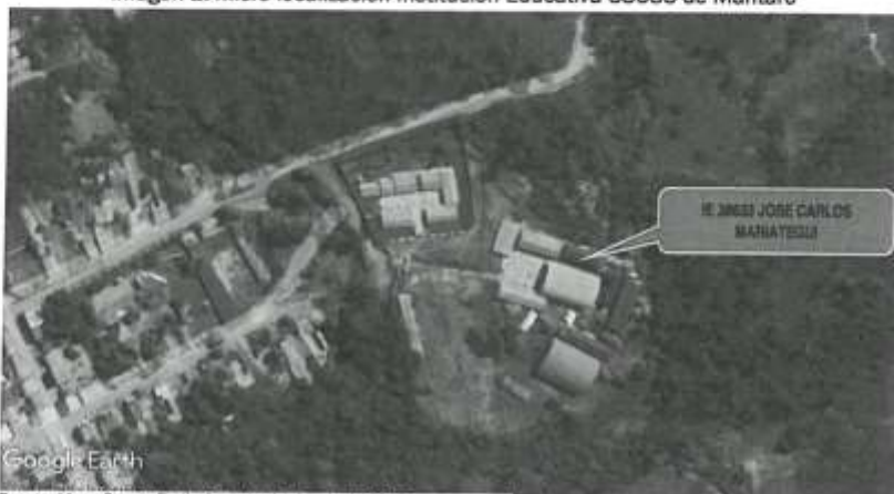
Imagen 2. Micro localización Institución Educativa 38633 de Mantaro