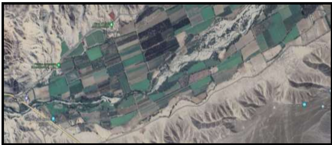
Figura N°2: Mapa Zona de Estudio