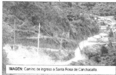
IMAGEN: Camino de ingreso a Santa Rosa de Canchacalla.