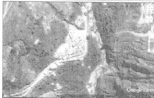
IMAGEN: Imagen satelital de la Localidad de Santa Rosa de Canchacalla.