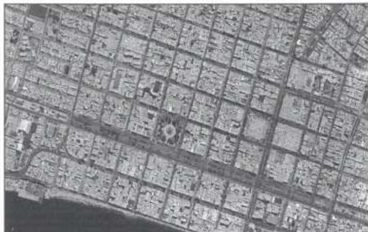
Imagen N°01.- Imagen Satelital. AV PARDO (TRAMO AV. AVIACIÓN HASTA LA AV. GUILLERMO MOORE) (dentro de la sección de color Rojo)

COORDENADAS UTM - DATUM WGS 84 - ZONA 17L