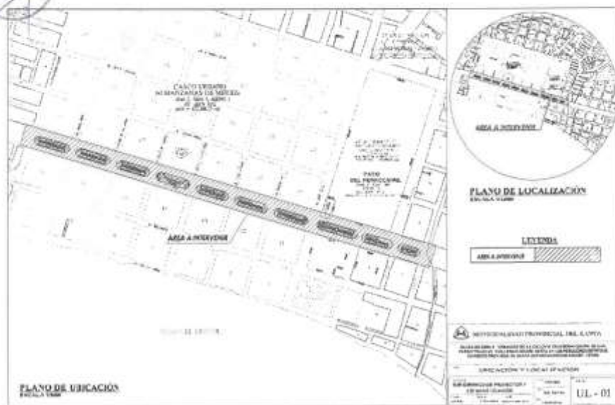
Imagen N°02.- Zona de Intervención. AV PARDO (TRAMO AV. AVIACIÓN HASTA LA AV. GUILLERMO MOORE)