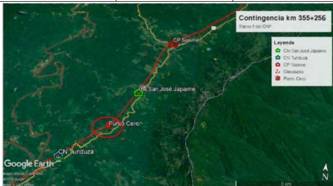
Figura N°1. Ubicación aprox. Km 355 + 256 del Tramo II.

EL CONTRATISTA ingresará por sus propios medios desde su lugar de origen, vía aérea, fluvial, terrestre u otro, para lo cual deberá contar con su movilidad.