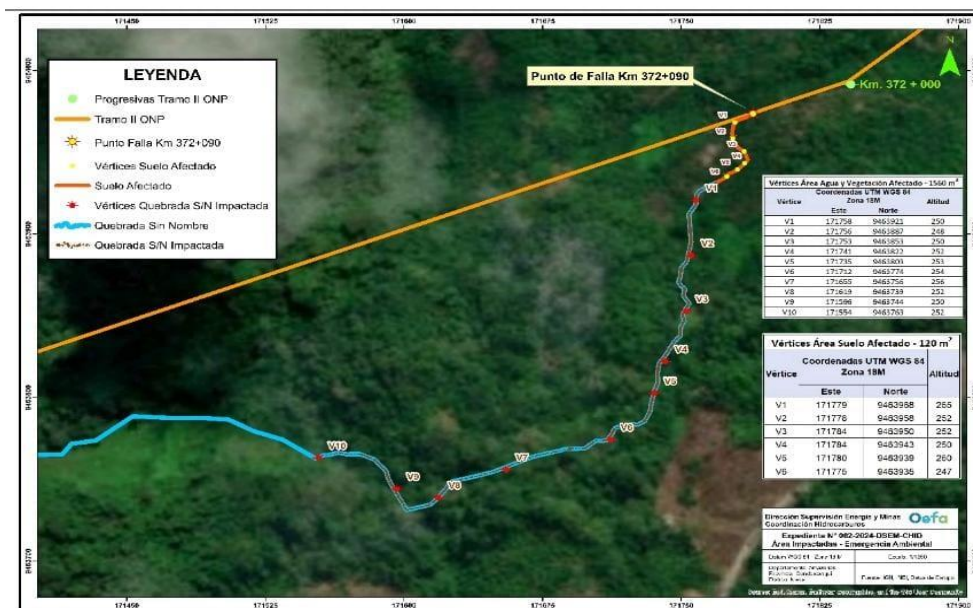
Figura 1. Localización del evento