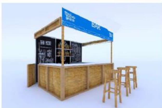
DISEÑO REFERENCIAL DEL STAND DE BARES REQUERIDO POR PROMPERÚ