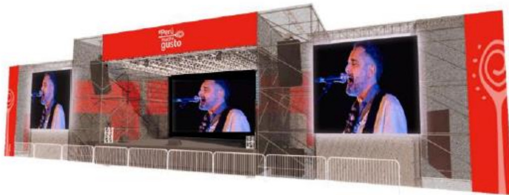
DISEÑO REFERENCIAL DEL ESCENARIO DE PRESENTACIONES MUSICALES REQUERIDO POR PROMPERÚ