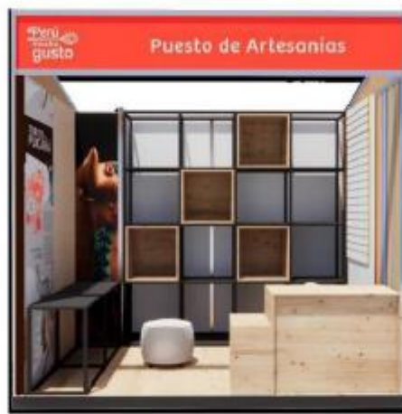
DISEÑO REFERENCIAL DEL STAND ARTESANÍAS REQUERIDO POR PROMPERÚ