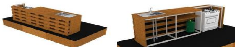
DISEÑO REFERENCIAL DE LA CLASE MAGISTRAL (SHOW COOKING) REQUERIDO POR PROMPERÚ