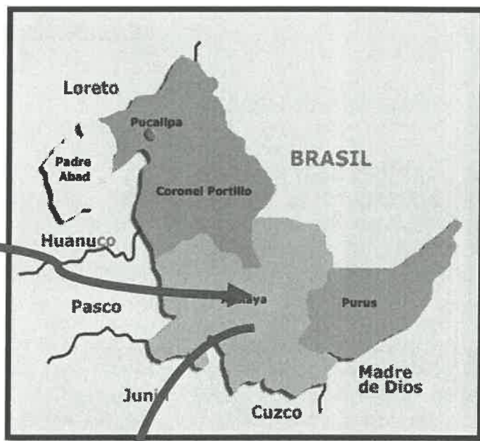
Mapa macro localización del Departamento de Ucayali