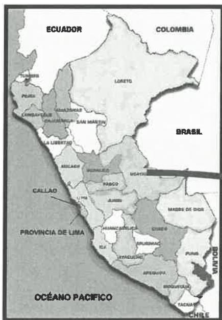
Mapa de macro localización