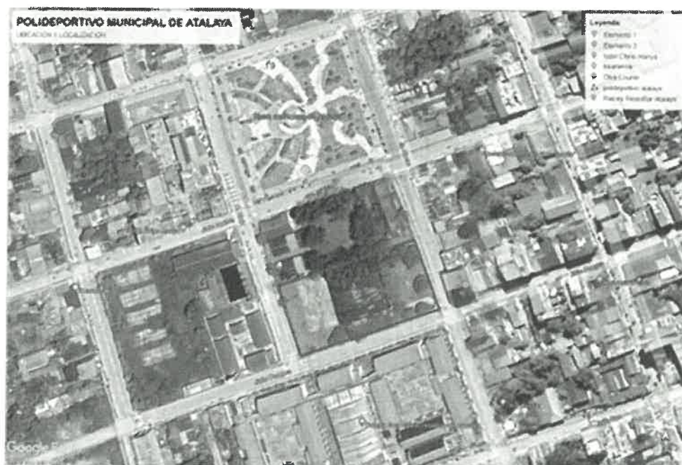
Ubicación del proyecto, vista Satelital