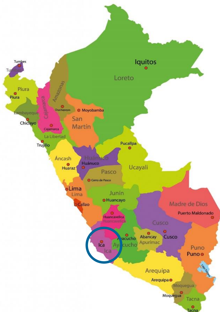
IMAGEN N°01 UBICACIÓN DEL DEPARTAMENTO DE ICA EN EL PERÚ