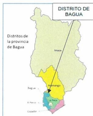
IMAGEN N° 02: UBICACIÓN DISTRITAL