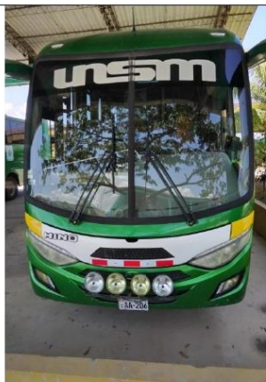
IMAGEN DEL DE BUS HINO

OFICINA DE MANTENIMIENTO Y SERVICIOS GENERALES