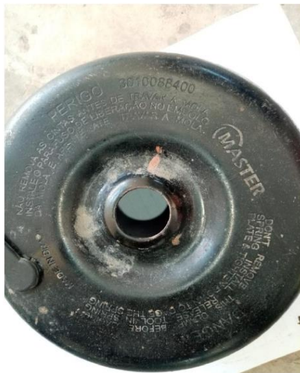
IMAGEN DEL CASCO DEL PULMON POSTERIOR CANTIDAD: 04

HINO CODIGO : 3010088400 BUS MARCA : HINO MODELO : DRAKO SERIE-CHASIS : 9F3FC9JKTHXX11030 MOTOR : JO5EUA11167 AÑO : 2017 CARROCERIA : APPLE BUS CODIGO : 3010088400