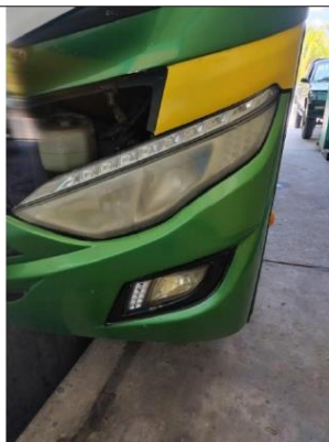
IMAGEN FARO DELANTERO IZQUIERDO CON NEBLINERO

OFICINA DE MANTENIMIENTO Y SERVICIOS GENERALES