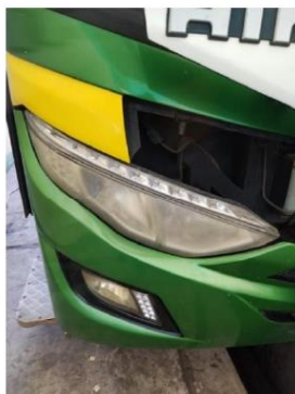
IMAGEN FARO POSTERIOR DELANTERO DERECHO CON NEBLINERO