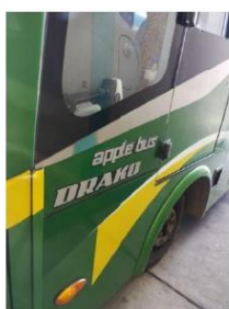
MODELO DEL BUS