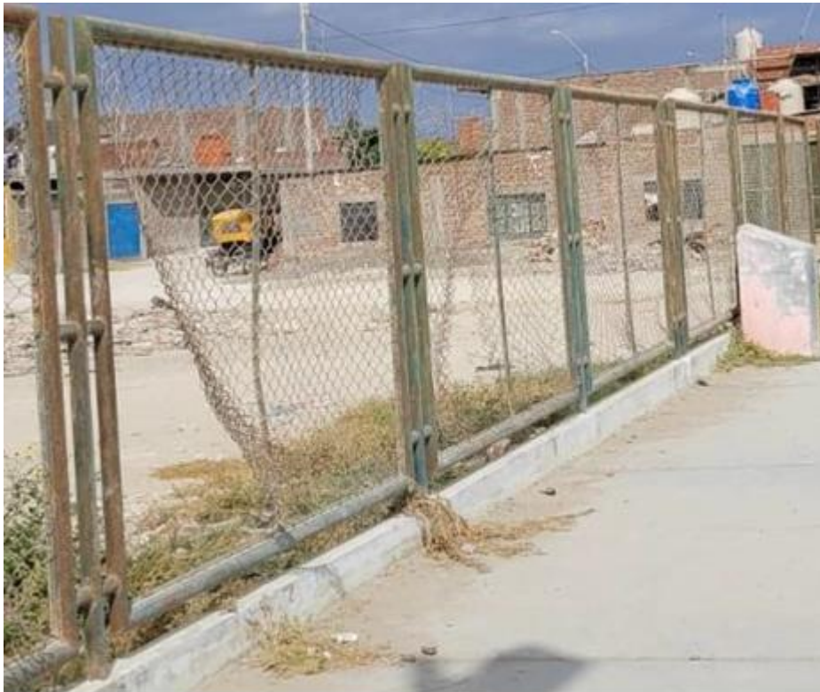
Imagen N°03: Malla de Arco deteriorada.