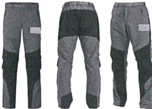
Pantalón de Campo con protección UPF para trekking (Foto Referencial)