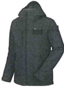
Casaca Impermeable (Foto referencial)

Para la muestra , el proveedor adjudicado presentará como mínimo una prenda de preferencia talla M, para determinar color y modelo.