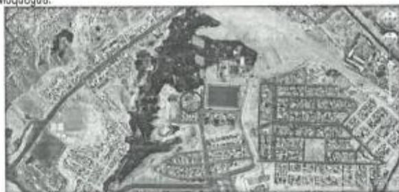
(Imagen Satelital de la ubicación del Proyecto)