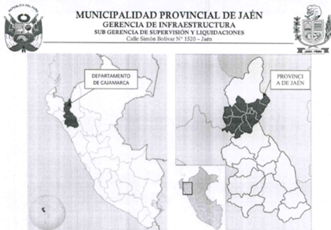
GRAFICO N° 2. LOCALIZACIÓN DISTRITAL DE LA ZONA DEL PROYECTO