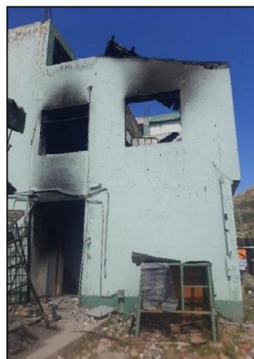
Imagen N°2: Vista del predio de la Comisaría PNP de Juli.

El terreno donde se construirá la infraestructura de la comisaría PNP Juli tiene un área de 1,591.96 m 2 , inscrito en la Partida N° P47016637, teniendo como titular al Ministerio del Interior – Policía Nacional del Perú, tal como se aprecia en la siguiente imagen: