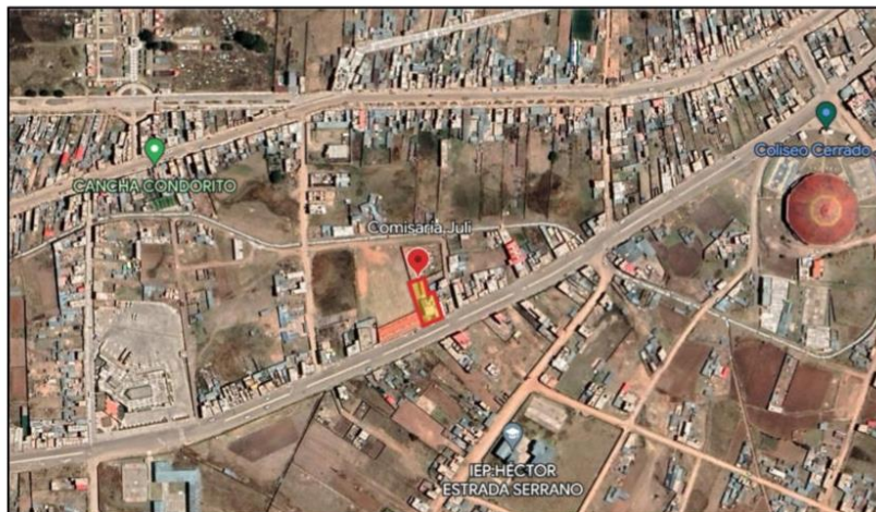
Imagen N°1 : Ubicación y localización del predio de la comisaría PNP de Juli.