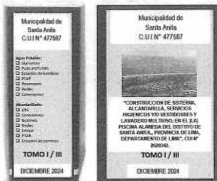
Figura N° 01

RUC: 20131369043 Código de Ubigeo: 150112 Provincia de Lima – Departamento de Lima – República del Perú Fecha de Creación del Distrito de Santa Anita: 25 de octubre 1898