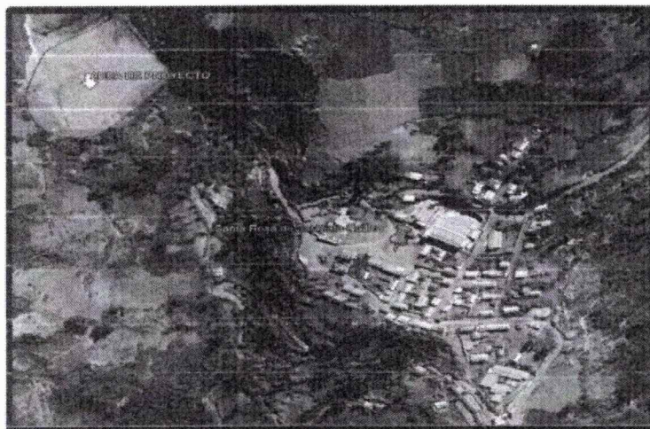
Figura N° 2: Micro localización del proyecto