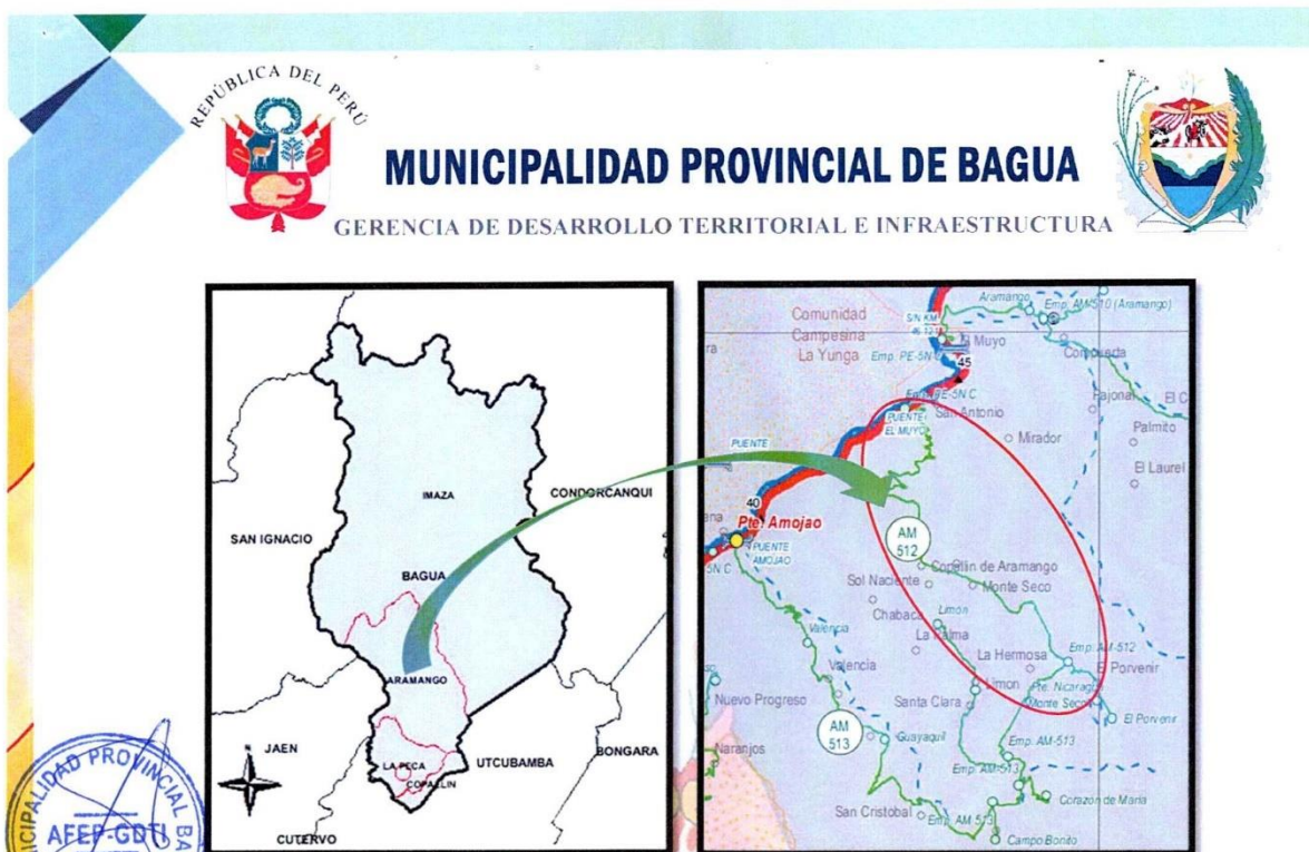
Gráfico 2. Ubicación del distrito de Aramango en el mapa de la provincia de Bagua y ubicación del camino vecinal AM-512 en el mapa vial del MTC