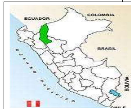
Ubicación de la Región de Amazonas en el Perú

Localidades: Molinopampa – Casmal - Huascazala