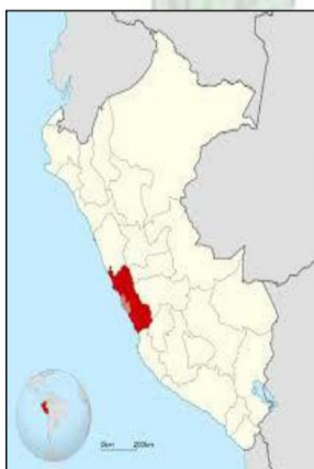
Imagen 1.1. Departamento de LIMA