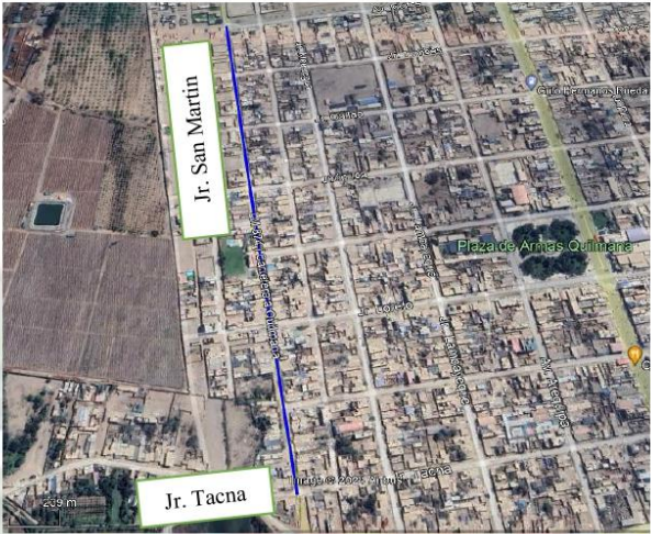
Imagen 1.4. Geolocalización del lugar de la Ejecución de la Obra: Jr. San Martín entre la Jr. Tacna y Jr. Iquitos

“Año de la recuperación y consolidación de la economía peruana”