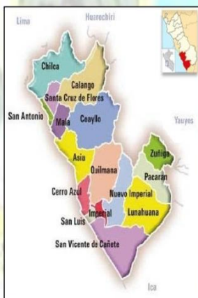
Imagen 1.2. Provincia de CAÑETE