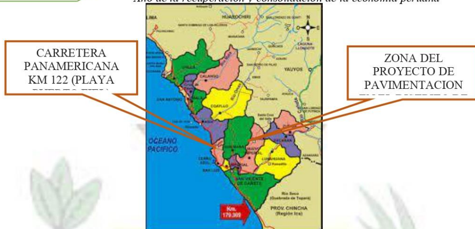
Imagen 1.6. Mapa de la red vial de la provincia de cañete – Acceso del distrito de Quilmaná.

“Año de la recuperación y consolidación de la economía peruana”