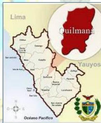
Imagen 1.3. Distrito de QUILMANA