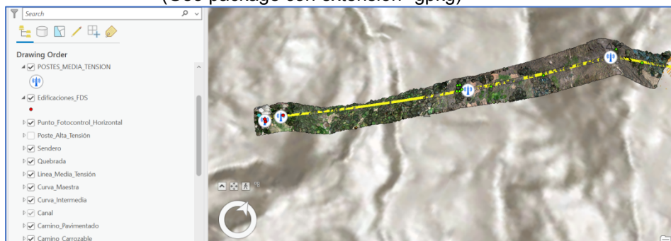
Imagen N° 3: Información consolidada en solo paquete de archivos (Geo package con extensión *.gpkg)