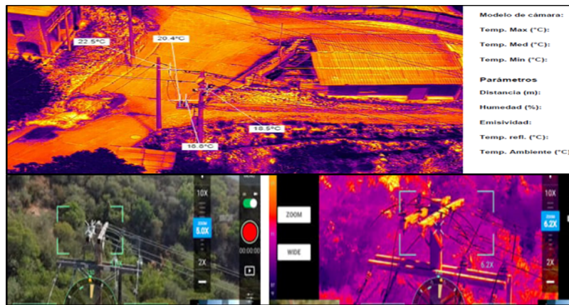
Imagen N° 2: Imágenes termográficas con detalle de temperatura