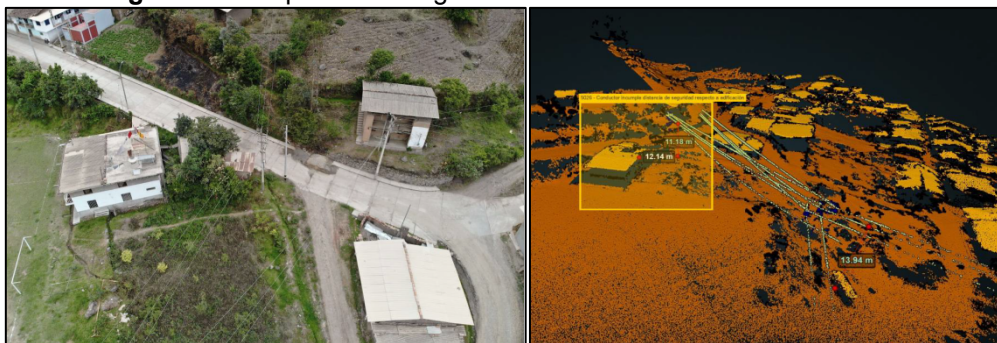
Imagen N° 1: Captura de imágenes con medición de distancias