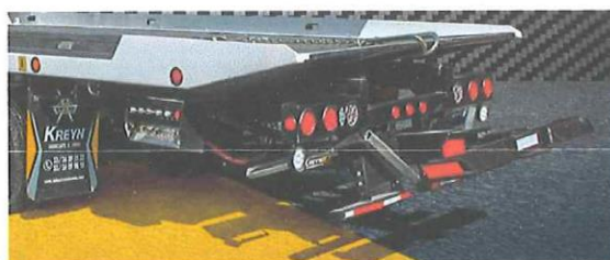
Brazos hidráulicos (Wheel Lift)