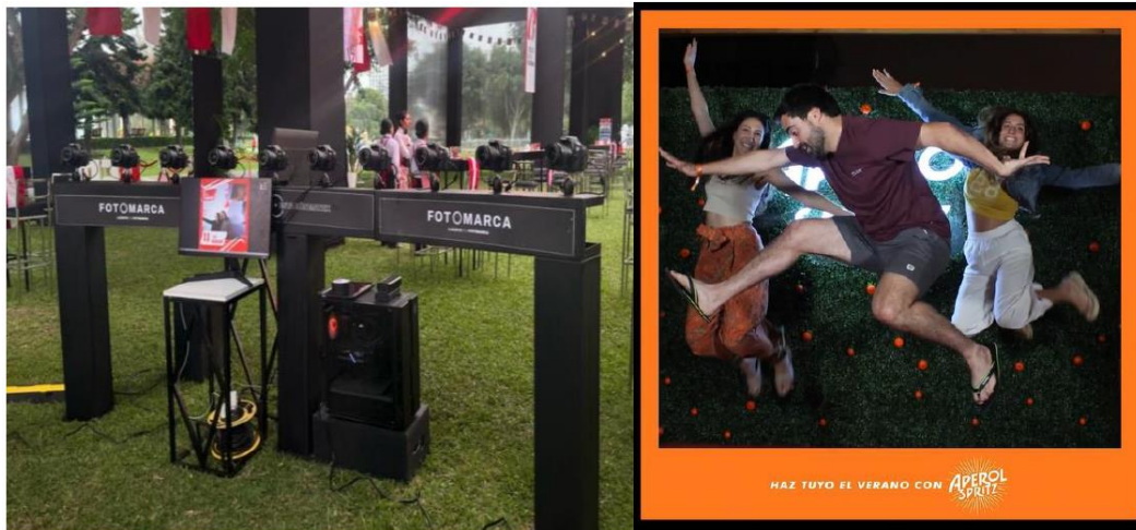
Imagen referencial de lo requerido por PROMPERÚ