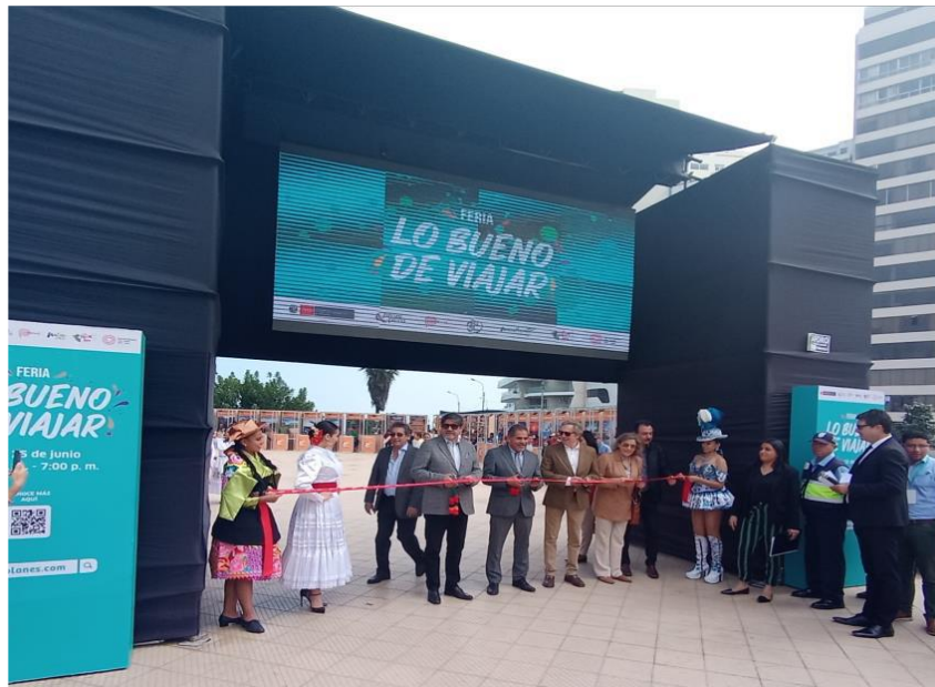
Imagen referencial de lo requerido por PROMPERÚ