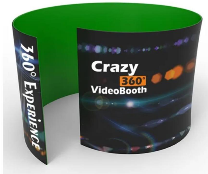
Imagen referencial de lo requerido por PROMPERÚ