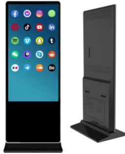
Imagen referencial de lo requerido por PROMPERÚ