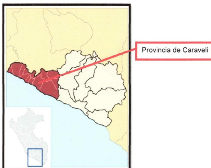
Figura N° 1 Ubicación General: Región Arequipa y Provincia Caraveli