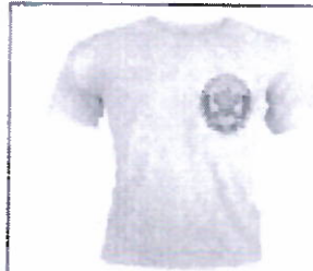
MODELO POLO CUELLO REDONDO