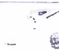
MODELO POLO CUELLO CAMISERO