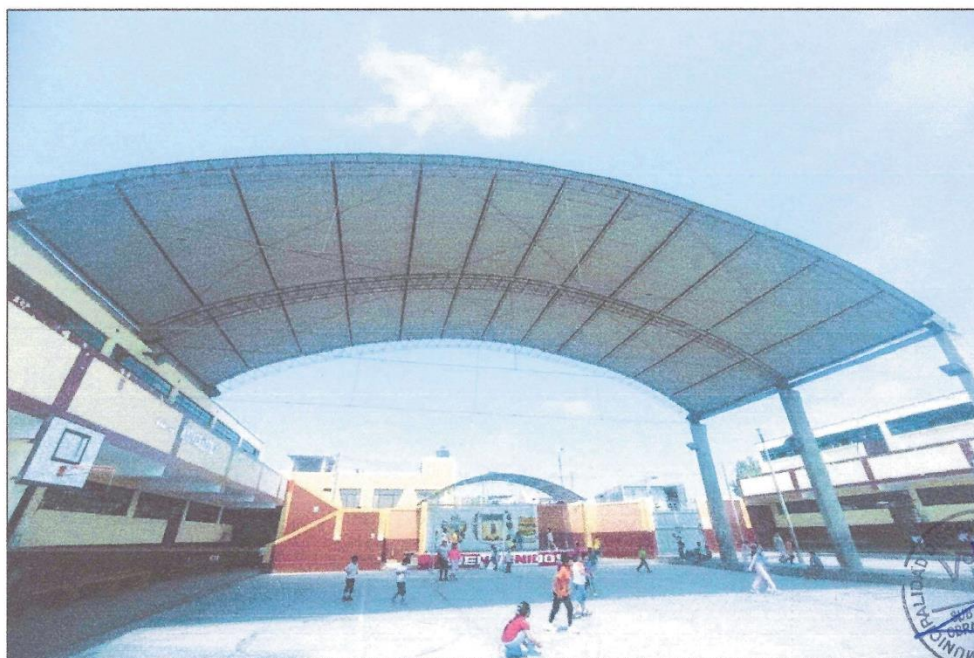
PATIO PRINCIPAL DE LA I.E N°22358

Pero, a su vez, las características térmicas favorables de este tipo climático han permitido la fijación de un cuadro de cultivos amplio y diversificado.