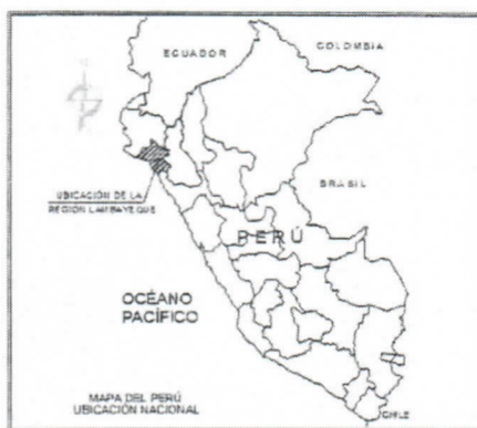
Emplazamiento Departamento de Lambayeque