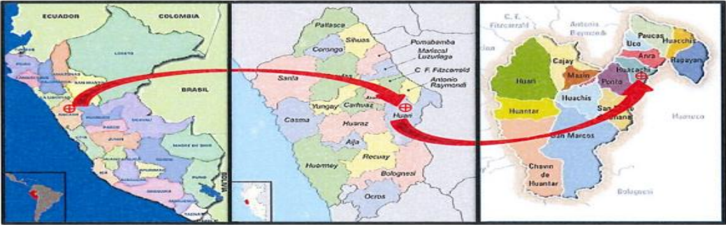
Distrito de Huacachi, provincia de Huari, departamento de Ancash.

Este : 0287990.24 m Norte : 8970731.25 m Altitud : 3595 m.s.n.m.