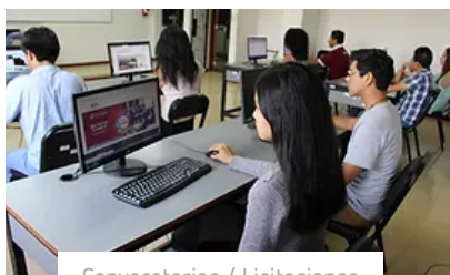
Convocatorias / Licitaciones