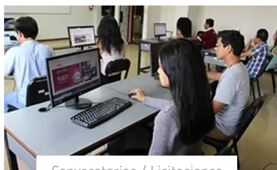
Convocatorias / Licitaciones